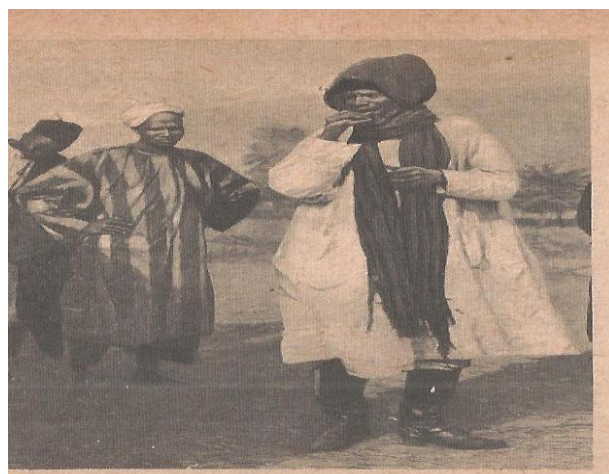
Samory et ses collaborateurs.

Il s'établit bientôt à Sanankoro , avec une poignée d'hommes et fit la guerre pour son propre compte, quand ses oncles maternels finirent par lui confier une armée.